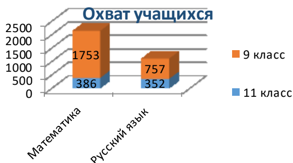
Рис.: Охват учащихся выпускных классов дистанционными уроками

Активно подключались к дистанционным урокам следующие образовательные организации: