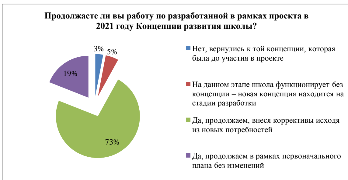
Рисунок 5. Результаты опроса школ по дальнейшей реализации разработанной в рамках проекта в 2021 году Концепции развития

Практически единогласно директора школ считают востребованным продолжение реализации намеченных антирисковых целей и задач по проекту, при этом: 3 % школ вернулись к той концепции, которая была до участия в проекте, 5% школ функционирует без концепции – новая концепция находится на стадии разработки, 19 % – оставили план развития в первоначальной редакции без изменений; 73 % управленцев – внесли коррективы в действующие Концепции развития исходя из новых потребностей.