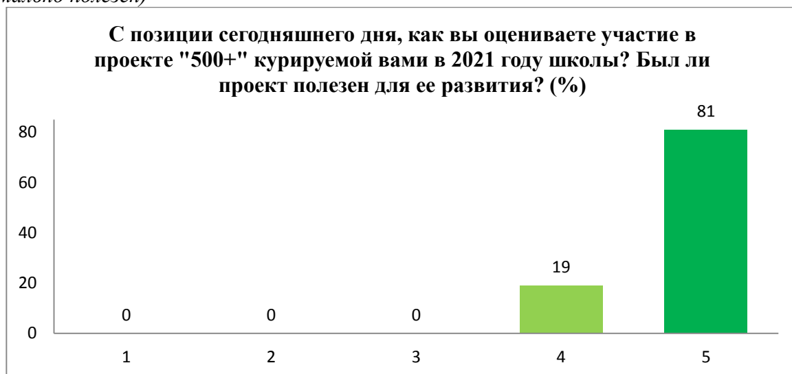
Рисунок 2. Оценка пользы опыта участия в проекте «500+» для развития школы кураторами ОО (пятибалльная шкала: 1 балл – совершенно бесполезен; 5 баллов – максимально полезен)