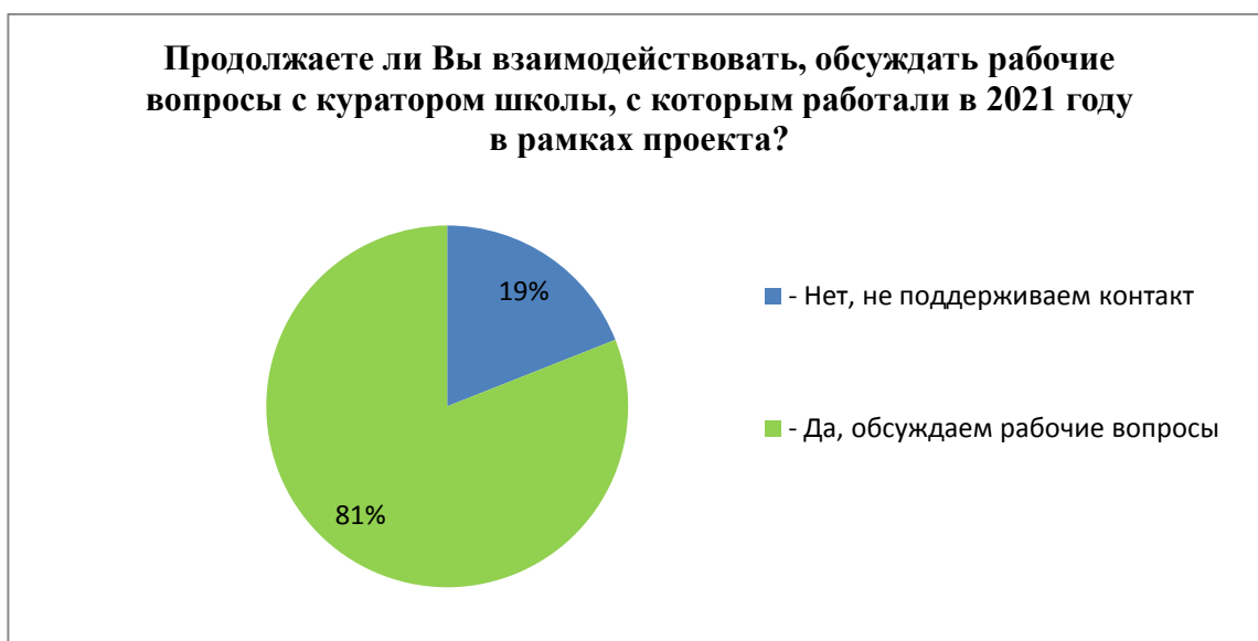
Рисунок 6. Результаты опроса директоров школ о сотрудничестве с кураторами

При ответе на вопрос о взаимодействии школ-участниц и кураторов по реализации проекта в текущем году также наблюдается положительная тенденция – 81% директоров и 89% кураторов отметили, что продолжают активное сотрудничество и взаимоподдержку.