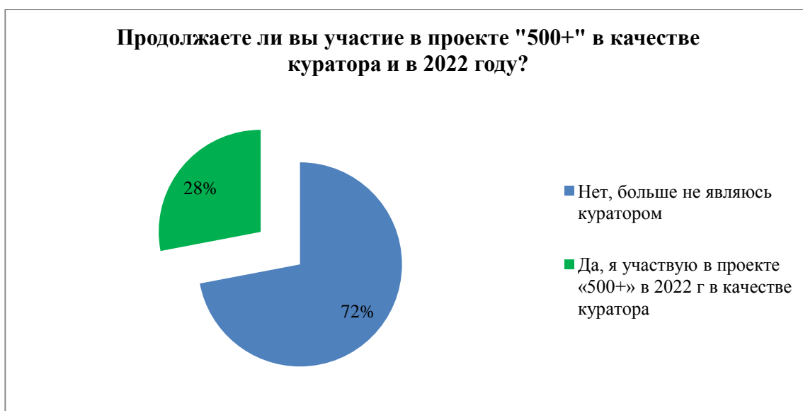
Рисунок 8. Результаты опроса кураторов об участии в проекте в качестве куратора и в 2022 году

Анализ использования школами-участницами и кураторами 2021 года имеющихся в рамках проекта информационно-методических ресурсов показал, что подавляющее большинство участников предпочитают искать необходимые для профессионального развития материалы самостоятельно, а также используя методические наработки регионального и муниципального уровней (97% респондентов). Более половины респондентов проекта получают информацию через еженедельное участие в вебинарах по обмену опытом и посредством общения в телеграм-канале «Проект 500+».