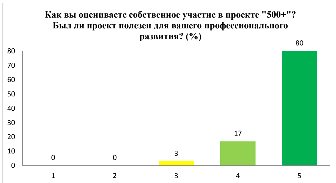
Рисунок 4. Оценка пользы участия в проекте «500+» кураторов школ для собственного профессионального развития (пятибалльная шкала: 1 балл – совершенно бесполезен; 5 баллов – максимально полезен)

Практически единогласно директора школ считают востребованным продолжение реализации намеченных антирисковых целей и задач по проекту, при этом: 3 % школ вернулись к той концепции, которая была до участия в проекте, 5% школ функционирует без концепции – новая концепция находится на стадии разработки, 19 % – оставили план развития в первоначальной редакции без изменений; 73 % управленцев – внесли коррективы в действующие Концепции развития исходя из новых потребностей.