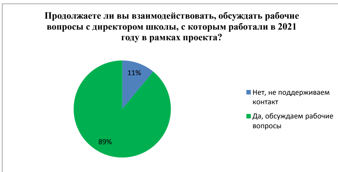
Рисунок 7. Результаты опроса кураторов о сотрудничестве с курируемой школой

Необходимо отметить тот факт, что 28% кураторов прошлого года, имеющих опыт работы в проекте, продолжили работу куратором в рамках проекта 2022 года.