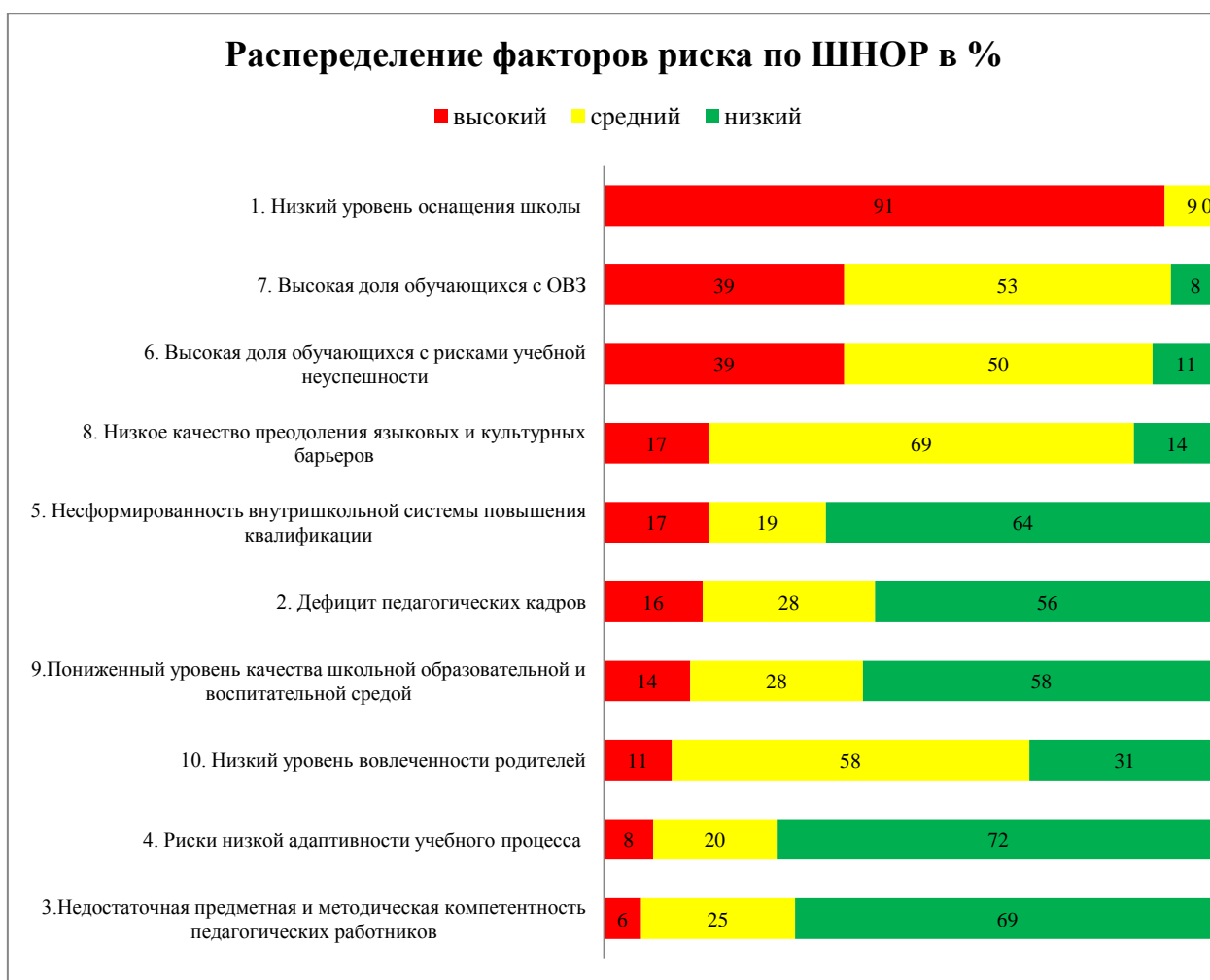
Рисунок 2. Распределение рисков по школам, участвующим в проекте адресной помощи в 2022 году

Наиболее распространенным стал риск наличия большой доли обучающихся с высокими рисками учебной неуспешности. Он был выявлен в той или иной степени в 39% образовательных организаций, участвующих в проекте. Из чего можно сделать вывод, что основными причинами повышения рисков низких образовательных результатов в школах, помимо слабой материальной базы, являются отсутствие у педагогов методических и предметных компетенций, позволяющих эффективно работать с рискованным контингентом, а также недостаточно сформированная система повышения квалификации педагогов, зачастую направленная на неактуальные задачи.