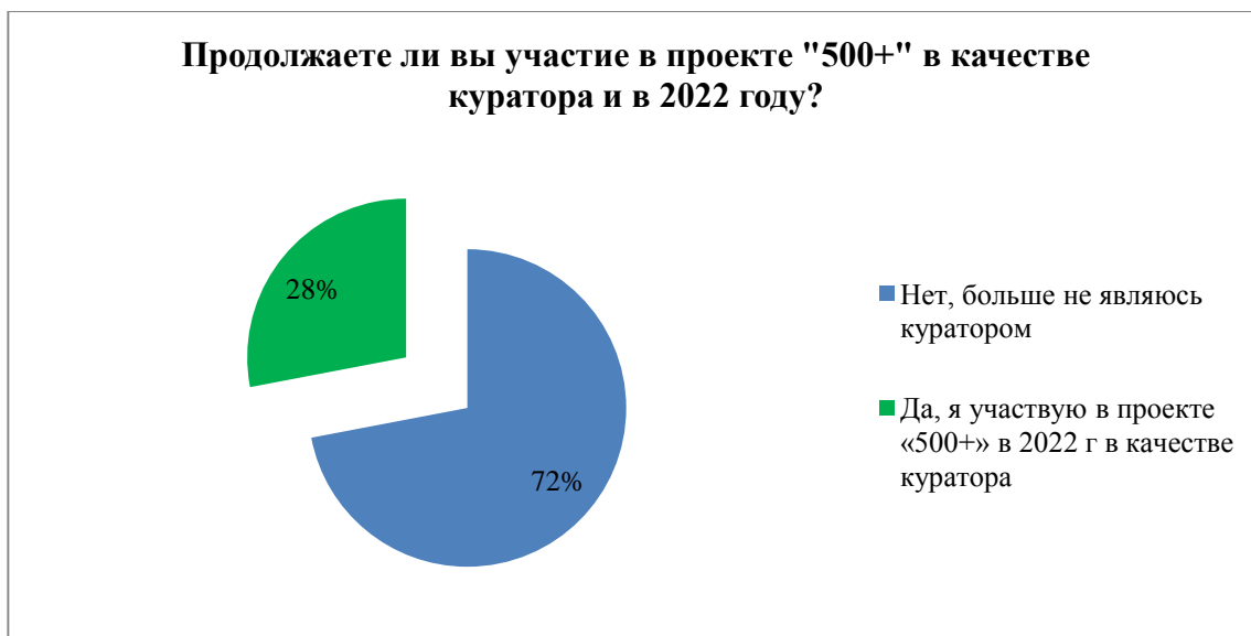
Рисунок 8. Результаты опроса кураторов об участии в проекте в качестве куратора и в 2022 году

Анализ использования школами-участницами и кураторами 2021 года имеющихся в рамках проекта информационно-методических ресурсов показал, что подавляющее большинство участников предпочитают искать необходимые для профессионального развития материалы самостоятельно, а также используя методические наработки регионального и муниципального уровней (97% респондентов). Более половины респондентов проекта получают информацию через еженедельное участие в вебинарах по обмену опытом и посредством общения в телеграм-канале «Проект 500+».