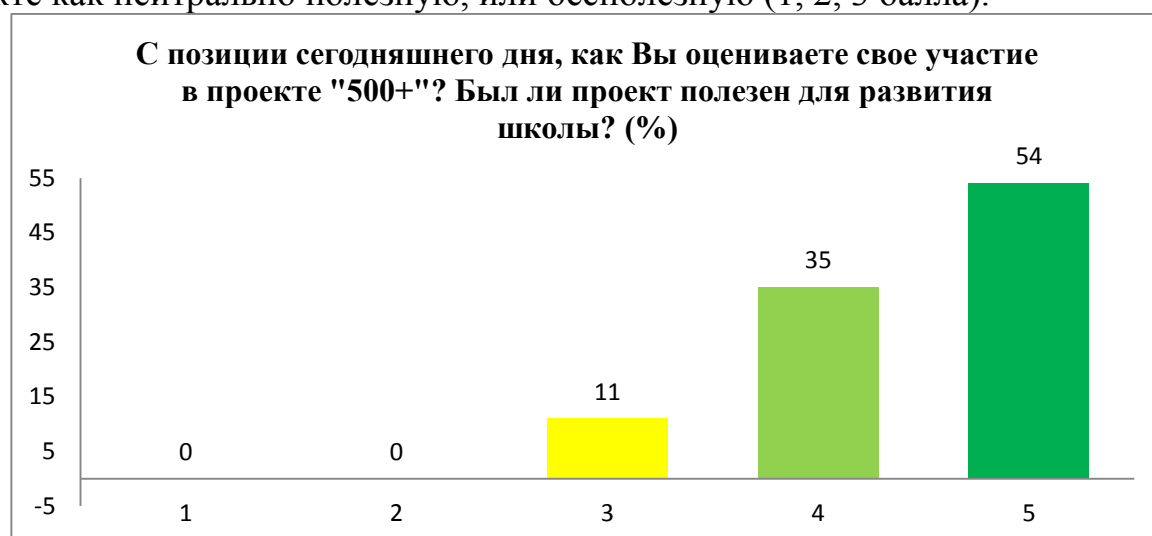
Рисунок 1. Оценка пользы опыта участия в проекте «500+» для развития школы директорами ОО (пятибалльная шкала: 1 балл – совершенно бесполезен; 5 баллов – максимально полезен)

Однако около 11 % директоров ОО оценили практику участия в проекте как нейтрально полезную, или бесполезную (1, 2, 3 балла).