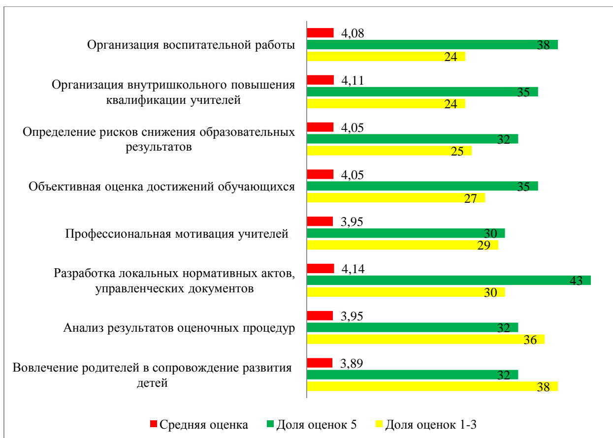
Рисунок 3. Доля выявленных профессиональных дефицитов в школах-участницах 2021 года

Следует отметить положительную оценку кураторов участия в проекте для собственного профессионального развития. 97% респондентов оценили практическую пользу участия на высоком уровне (5 баллов – 80% респондентов; 4 балла – 17%) и лишь 3% кураторов оценили опыт проекта как средний (3 балла).