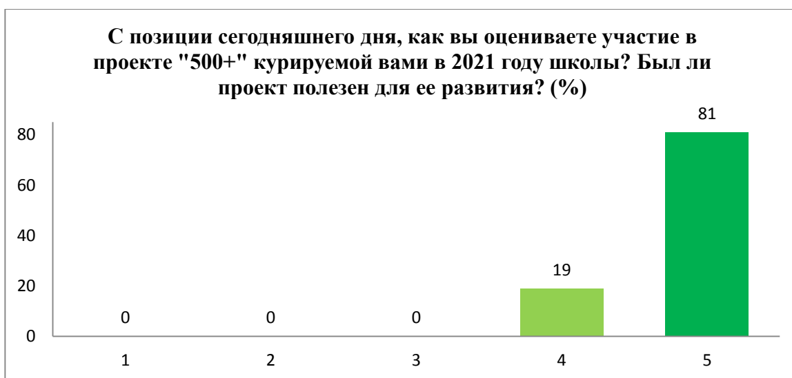
Рисунок 2. Оценка пользы опыта участия в проекте «500+» для развития школы кураторами ОО (пятибалльная шкала: 1 балл – совершенно бесполезен; 5 баллов – максимально полезен)

При этом кураторы в среднем оценивают проект как более полезный.