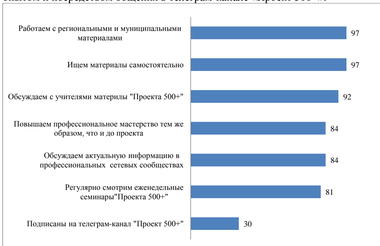
Рисунок 9. Результаты опроса участников проекта 2021 года об использовании информационно-методических ресурсов в рамках проекта

Анализ использования школами-участницами и кураторами 2021 года имеющихся в рамках проекта информационно-методических ресурсов показал, что подавляющее большинство участников предпочитают искать необходимые для профессионального развития материалы самостоятельно, а также используя методические наработки регионального и муниципального уровней (97% респондентов). Более половины респондентов проекта получают информацию через еженедельное участие в вебинарах по обмену опытом и посредством общения в телеграм-канале «Проект 500+».