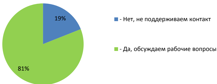
Рисунок 6. Результаты опроса директоров школ о сотрудничестве с кураторами

Продолжаете ли Вы взаимодействовать, обсуждать рабочие вопросы с куратором школы, с которым работали в 2021 году в рамках проекта?