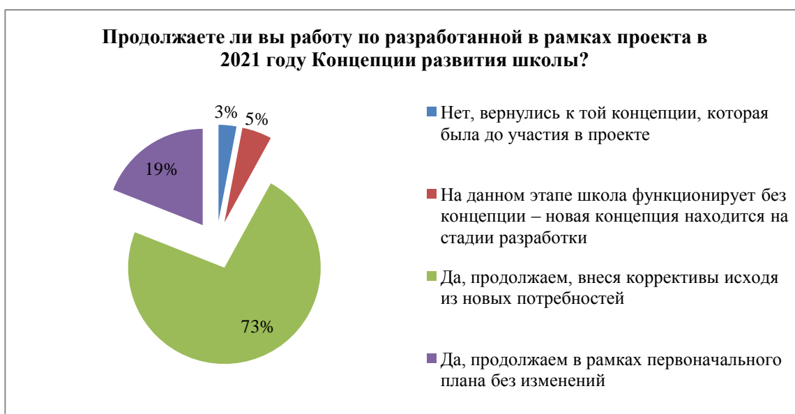
Рисунок 5. Результаты опроса школ по дальнейшей реализации разработанной в рамках проекта в 2021 году Концепции развития

Практически единогласно директора школ считают востребованным продолжение реализации намеченных антирисковых целей и задач по проекту, при этом: 3 % школ вернулись к той концепции, которая была до участия в проекте, 5% школ функционирует без концепции – новая концепция находится на стадии разработки, 19 % – оставили план развития в первоначальной редакции без изменений; 73 % управленцев – внесли коррективы в действующие Концепции развития исходя из новых потребностей.